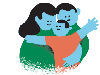
ਮਾਤਾ-ਪਿਤਾ-ਬੱਚੇ ਦੇ ਵਿਚਕਾਰ ਨਿਯਮਤ ਅਤੇ ਸਕਾਰਾਤਮਕ ਸੰਚਾਰ ਬਣਾਏ ਰੱਖਕੇ