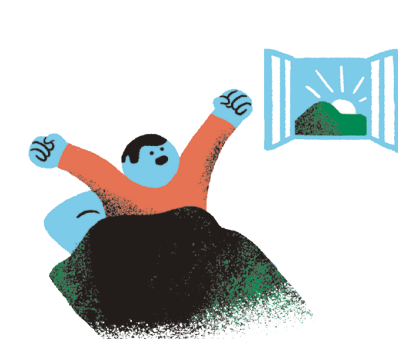
ਇਕਸਾਰ ਰੁਟੀਨ ਪ੍ਰਦਾਨ ਕਰਕੇ