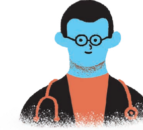
ਸਿਹਤ ਸੰਭਾਲ ਪ੍ਰਦਾਤਾਵਾਂ ਅਤੇ ਸਕੂਲ ਕਰਮਚਾਰੀਆਂ ਦੇ ਨਾਲ ਮਿਲ ਕੇ ਕੰਮ ਕਰਕੇ