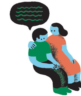
ਬੱਚੇ ਨੂੰ ਰੁਟੀਨ ਵਿੱਚ ਸੰਭਵ ਤਬਦੀਲੀਆਂ ਲਈ ਤਿਆਰ ਕਰਕੇ